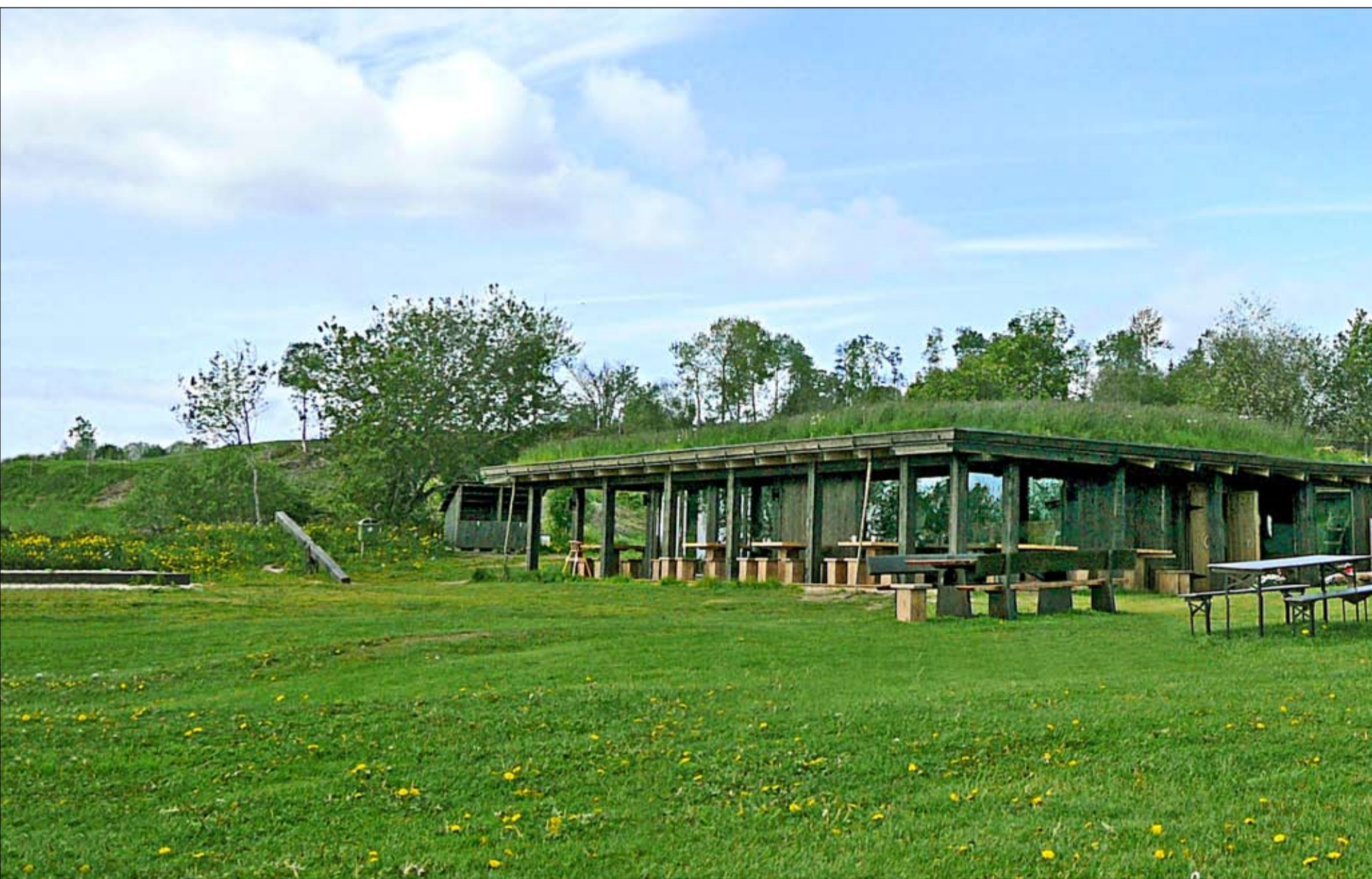
MEKTIG: Utsikten er fantastisk – både i gråvær og solskinn. Herfra ser man til sju kommuner, og sju kirkespir skal visstnok være synlig. Langhuset er 25 meter langt og sju meter bredt.